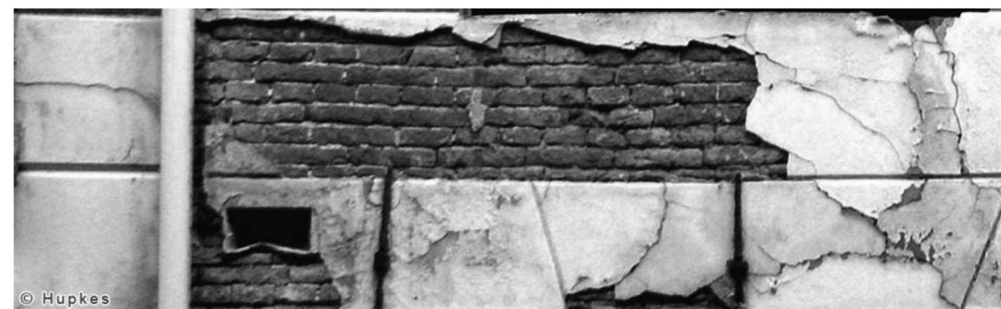
De gevel van Voorstraat 97. Onder de 19e eeuwse pleisterlaag is een fraaie 17e eeuwse bakstenen gevel waar te nemen.